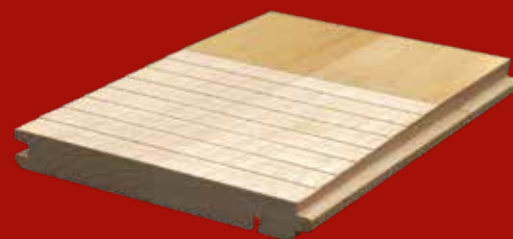
22 mm massiv parket

Se og føl forskellen i slidlag, tyngde og robusthed på de to typer trægulve.