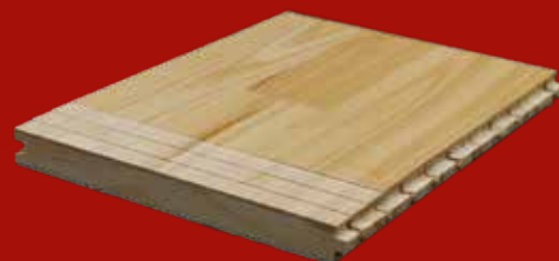
22 mm lamel parket (Slidlag 3,6 mm)